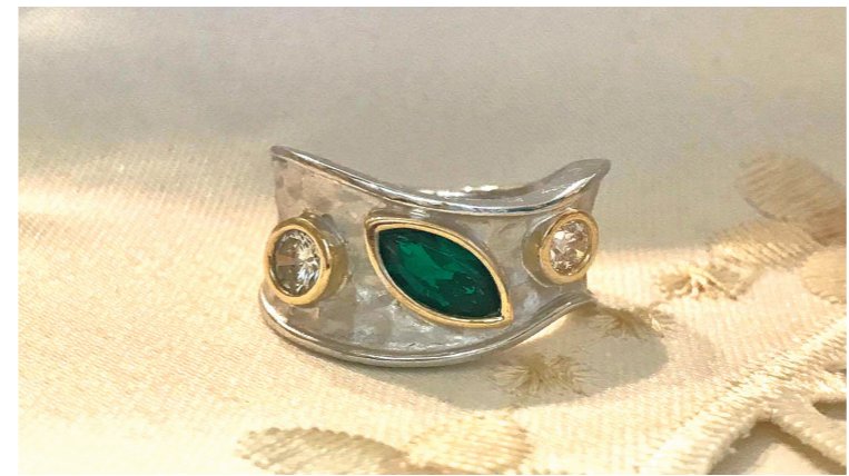
After 75歳でリモデル。「母が喜んでくれます。毎日身に着けています」と喜びの声をいただきました。

ジュエリーの生前整理はご自身の大切なジュエリーを見つめ直し、人生を振り返る機会としておすすめです。そのきっかけ作りとして付録の「マイジュエリーメモリーノート」を作りました。本誌とそとのノート、そしてジュエリーをお持ちになつて、まずはお店に相談してみましよう。